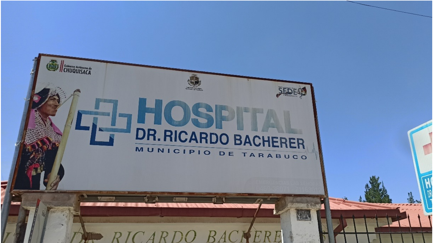
HOSPITAL RICARDO BACHERER DE TARABUCO